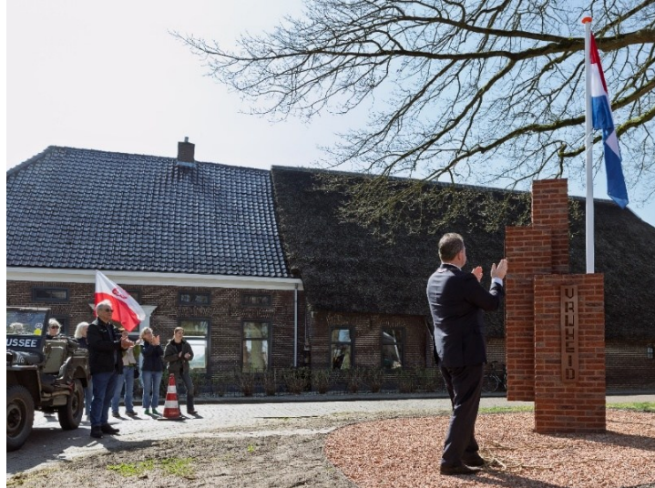
Onthulling van het Vrijheidsmonument door de burgemeester

Het comité 80 jaar bevrijding van Erm werd verrast door de enorme opkomst bij de herdenking van de tachtigjarige bevrijding van Erm en de onthulling van het Vrijheidsmonument. Deze herdenking en de bouw van het monument hebben een breed draagvlak gekregen binnen Erm en Achterste Erm.